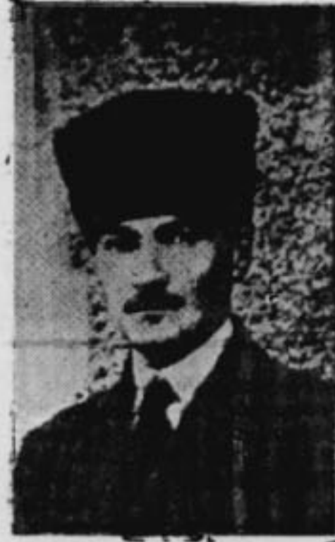
Yurtta sufl, Cihanda sufl.

Alman nazizminin «hayat sahası» nazariyelerinden, İtalyan faşizminin pervasız tecavüz hareketlerinden Türkiye'de derin endişeler duyulmaya başlamıştı. Türkiye, millet lerarası bir dayanak arıyordu. Bu ihtiyaç, Türk—İngiliz—Fransız, Ankara ittifakını doğurdu. Bu ittifak en menfi tepkiye Sovyetler Birliği'nde maruz kaldı. Sovyetler Birliği Dışişleri Bakanı Vyaçeslav Molotov, Yüksek Sovyet Şurasında söylediği nutukta Ankara ittifakına ve Türkiye'nin bu ittifaka müncer olan politikasına giddetle ve ağır bir üsulan hücum etti. Bugün gibi hatırımızdadır, bu çok sert nutuk şu cümle ile son buluyordu: «Temennî ederiz ki Türkiye, bir gün bu siya-