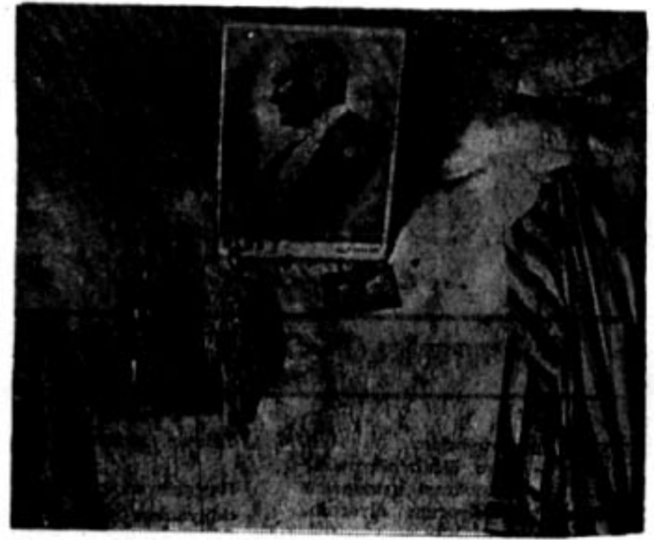
Karanlık bir kovuğun aydınlık köşesi.

Türkiyede henüz kaya kovuğunda yaşayan insanlar vardır Hıfzı Oğuz BEKATA